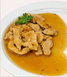
Putengeschnetzeltes in feiner Bratensoße