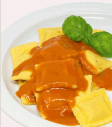
Ravioli mit Truthahnfleischfüllung, in Tomatenrahmsauce