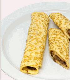
Nougat-Pfannkuchen mit cremiger Nougat-Füllung